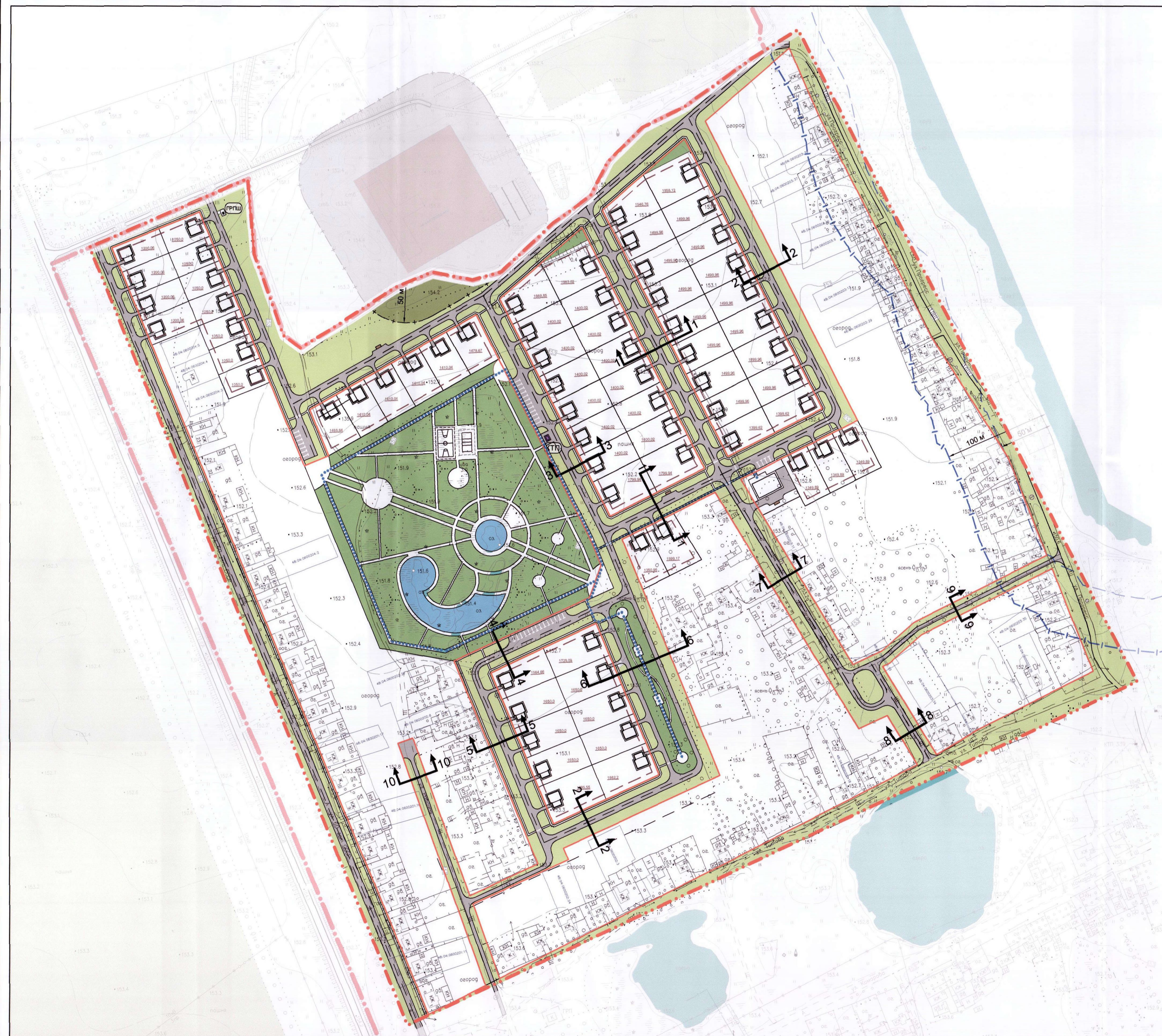
СХЕМА ОРГАНИЗАЦИИ УЛИЧНО-ДОРОЖНОЙ СЕТИ И ДВИЖЕНИЯ ТРАНСПОРТА НА СООТВЕТСТВУЮЩЕЙ ТЕРРИТОРИИ. ПОПЕРЕЧНЫЕ ПРОФИЛИ УЛИЦ И ДОРОГ. МИКРОРАЙОН "ПРОГРЕСС". МАСШТАБ 1:2000