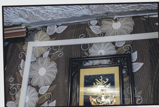
Хозяева сейчас радуются аккуратно проведённой электропроводке.