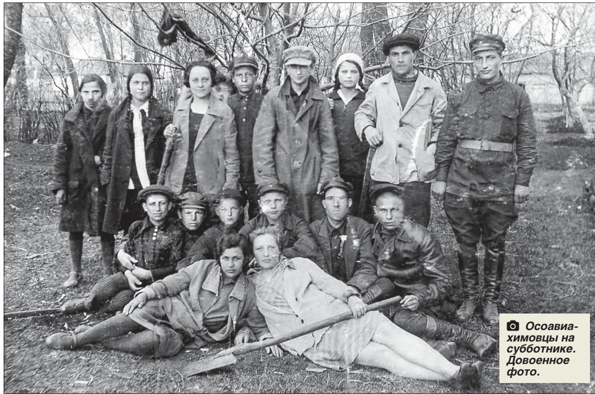
Осоавиахимовцы на субботнике. Довоенное фото.