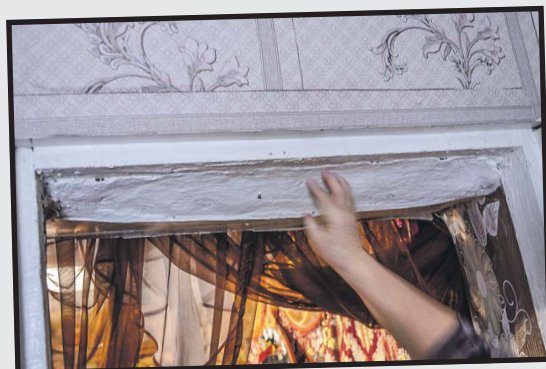
У притолоки, над порогом, висит эта «люлька».